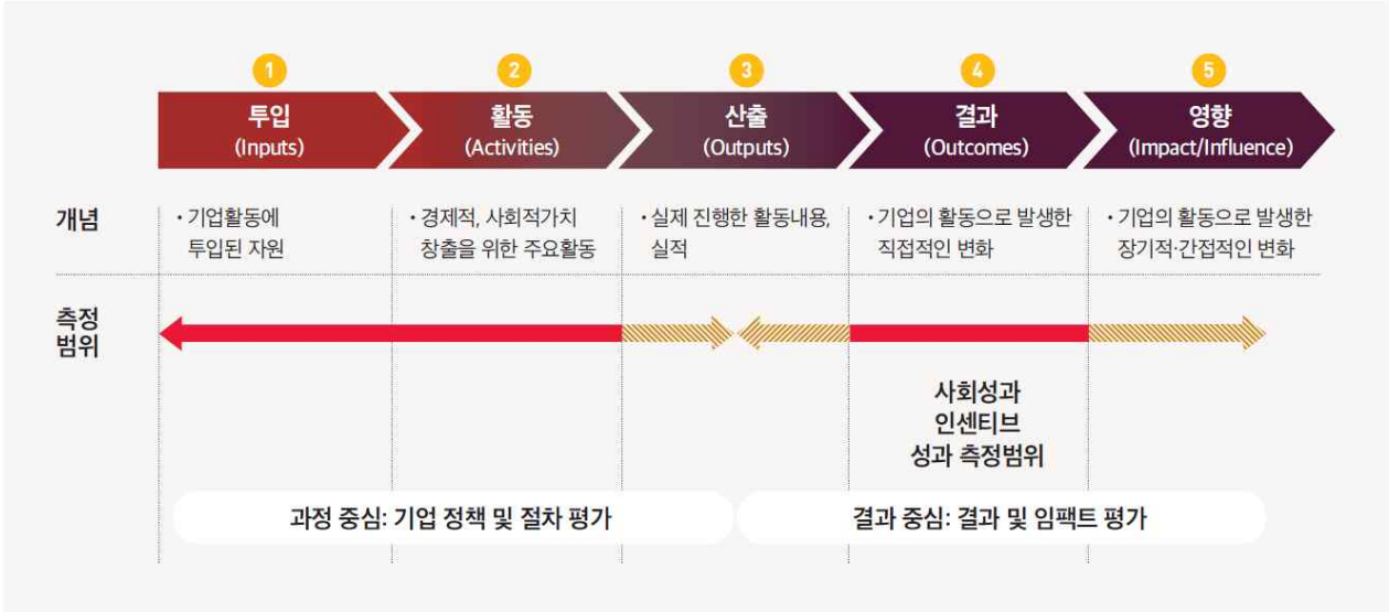
<그림> 논리모형 기반 사회성과 측정범위